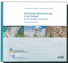
Leitungsgruppe NFP 61 (Hrsg.): Nachhaltige Wassernutzung in der Schweiz

Nach vierjähriger Forschungsarbeit wurden nun die wichtigsten Ergebnisse in Buchform publiziert. Dem Buch liegt eine DVD mit Videoclips bei: Zu Beginn des Programms erläuterten die Leiter der 16 Forschungsprojekte, welche Fragen sie untersuchen wollen und weshalb diese für die Gesellschaft relevant sind; kurz vor Abschluss standen die Forscher noch einmal vor der Kamera und berichteten über die Ergebnisse. 2