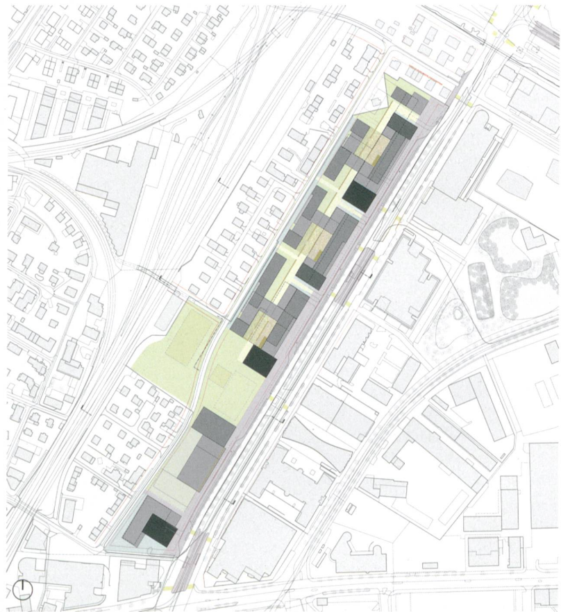
Grundstein für die weitere Entwicklung: das städtebauliche Konzept von Marcel Meili, Markus Peter Architekten, Situationsplan im Mst. 1:6000.

Das Amt für Städtebau der Stadt Zürich hat dahingehend ein Testplanungsverfahren durchgeführt. Gemeinsam mit drei ausgewählten, interdisziplinären Teams und einem breit zusammengesetzten Begleitgremium, bestehend aus internen und externen Fachpersonen, wurde ein städtebauliches Konzept für das Areal erarbeitet und evaluiert. Die drei Planungsteams mit den Büros Marcel Meili, Markus Peter Architekten, Michael Meier Marius Hug Architekten und 51N4E verfolgten kontroverse und sehr unterschiedliche Stossrichtungen, die im Lauf des mehrstufigen Verfahrens zusammen mit dem Begleitgremium konkretisiert, vertieft und überar-