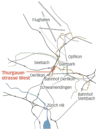
Der Standort Leutschenbach im Norden von Zürich hat ideale Verkehrsanbindungen.

auch für diejenigen, die dereinst in den heute noch in Planung und Bau befindlichen Siedlungen Leutschenbach-Kopf oder Leutschenbach-Mitte leben werden oder im Schulkreis Glätttal wohnen.