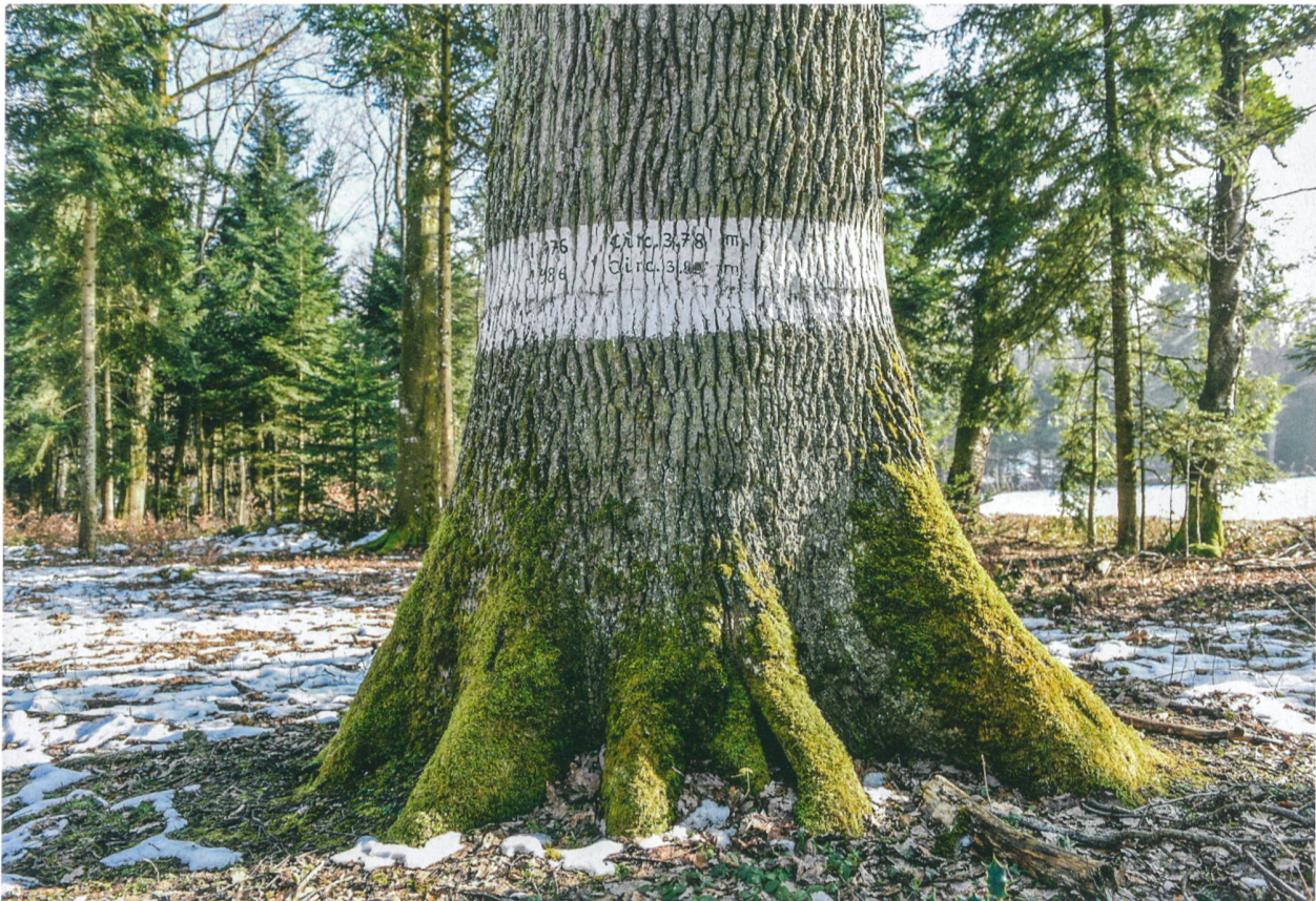
Der «Chêne Président» wird alle zehn Jahre vom Forstinspektor vermessen. Im Anschluss wird mit einem Glas Wein auf die Gesundheit der rund 250-jährigen Eiche angestossen.

F ür den Binding Waldpreis 2015 war ein Waldeigentümer gesucht, der sich in besonderer Weise für Uraltbäume einsetzt. Gefunden wurde er am Fuss des Juras: Die Waadtländer Gemeinde Baulmes zählt in ihren Wäldern über 7200 Bäume mit einem Durchmesser von mehr als 70 cm (und einem Umfang von deutlich mehr als 2 m). Die hiesigen Sägereien können solche Riesenbäume kaum mehr verarbeiten, doch stehen für den Holzmarkt genügend kleinere Bäume zur Verfügung. Die grossen und alten Bäume werden in Baulmes hingegen verehrt, gehegt und gepflegt.