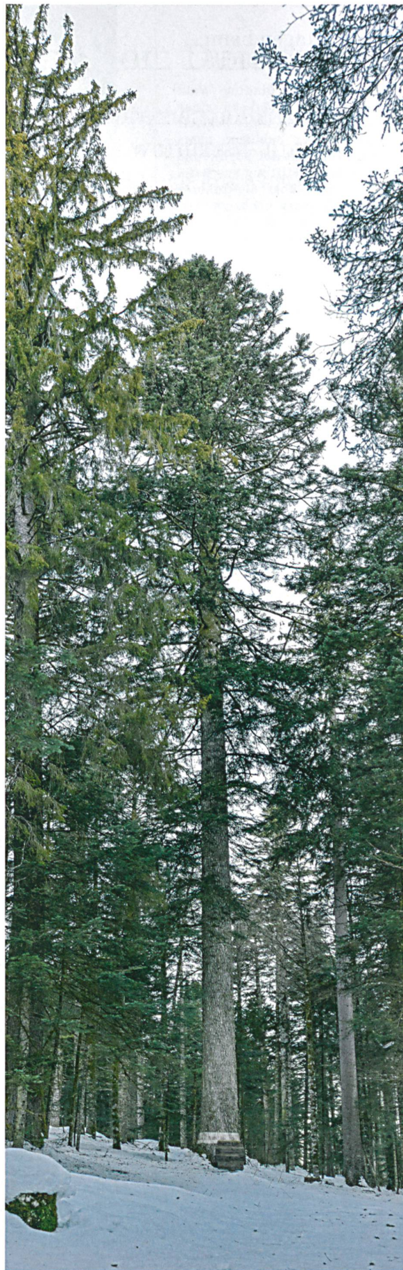
Die mächtigste Tanne im Wald: «Sapin Président», 300 Jahre alt und mit einem Umfang von 4.56 m.