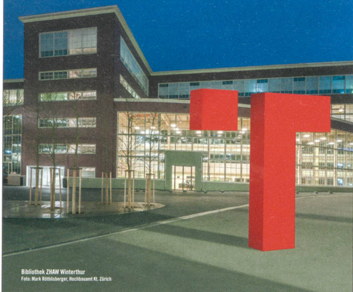
Bibliothek ZHAW Winterthur