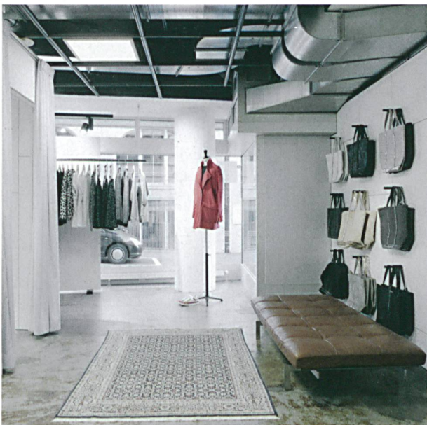
Schlichtes Eldorado für Modebegeisterte: Concept Store «Le Soir Le Jour» in St. Gallen.

Zwischen einem abgeschliffenen, versiegelten Betonboden und einer schwarzen, roh belassenen Technikdecke entstand auf zwei Stockwerken ein knapp 200 m 2 grosses Eldorado für Modebegeisterte. Die schlichte architektonische Sprache lässt die Kleider für sich wirken; für einen Überraschungsmoment sorgen grossformatige Bilder des Schweizer Künstlers Beni Bischof. In seinen Arbeiten reflektiert (und persifliert) er die Hochglanzfotografien der Modezeitschriften. Für ihre aktuelle Winterkollektion liess sich die Designerin Isabel Marant von Tänzern inspirieren. Im Laden wird dies mit der Projektion eines Videos der Tänzerin und Choreografin Pina Bausch untermalt.