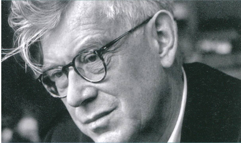
Max Dudler Architekt, Zürich

« Durch die handwerkliche Fügung des massiven, gebrochenen Natursteins erhält die Fassade ihre archaische, monolithische und kraftvolle Wirkung. Dabei verleiht das unregelmässige, zufällige Licht- und Schattenspiel der Oberfläche gleichzeitig den Gebäuden ihre Lebendigkeit. »