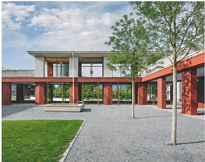
Alters- und Pflegeheim Neugut, Landquart, 2014, Joos & Mathys Architekten, in Zusammenarbeit mit Schmid Schärer Architekten.