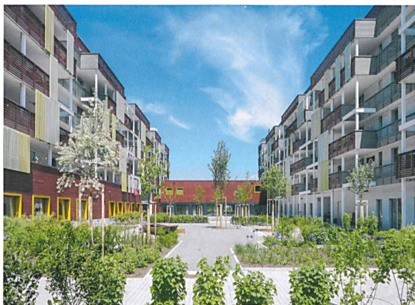
Das Mehrgenerationenhaus Gesewo in Winterthur zeigt, wie Holz in grösserem Massstab eingesetzt werden kann.

Die Frage, was mit der bestehenden Bausubstanz in Bergdörfern geschieht, stellt sich nach Annahme der Zweitwohnungsinitiative dringender denn je. Dass Veränderungen in diesem Umfeld keinen Alpenkitsch mit sich bringen müssen, zeigt der Umbau Sarreyer. Ein alter Heuschöber und ein Neubau auf dem Fussabdruck des benachbarten Vorgängerbaus wurden zu einem Wohnhaus zusammengefasst. Die Häuser sind formal und konstruktiv verwandt. Während der alte, denkmalgeschützte Holzbau integral er-