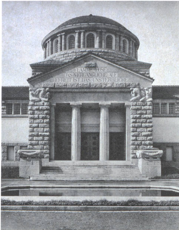
Ansicht des Haupteingangs des Krematoriums Sihlfeld von Architekt Albert Froelich (Brugg).