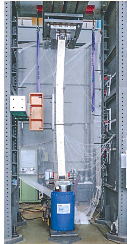
Knickversuche an Brettschichtholz-Stützen an der ETH Zürich

Die Stabilität von Einzelstäben weist man üblicherweise mit dem Ersatzstabverfahren nach. Die entsprechenden Knickkurven und Formeln zur Berechnung der Knickbeiwerte k_C in Funktion der relativen Schlankheit \lambda_{rel} der Stäbe sind in der Norm SIA 265 angegeben. Auch diese Bemessungsansätze wurden aus dem Eurocode 5 in die Schweizer Norm übernommen. Bei der Berechnung der relativen Stabschlankheit, die neben der geometrischen Schlankheit \lambda = l_k/i (Knicklänge l_k , Stabquerschnitt bzw. Trägheitsradius i ) den Einfluss der Materialisierung des Stabes (Elastizitätsmodul) umfasst, geht man wegen der