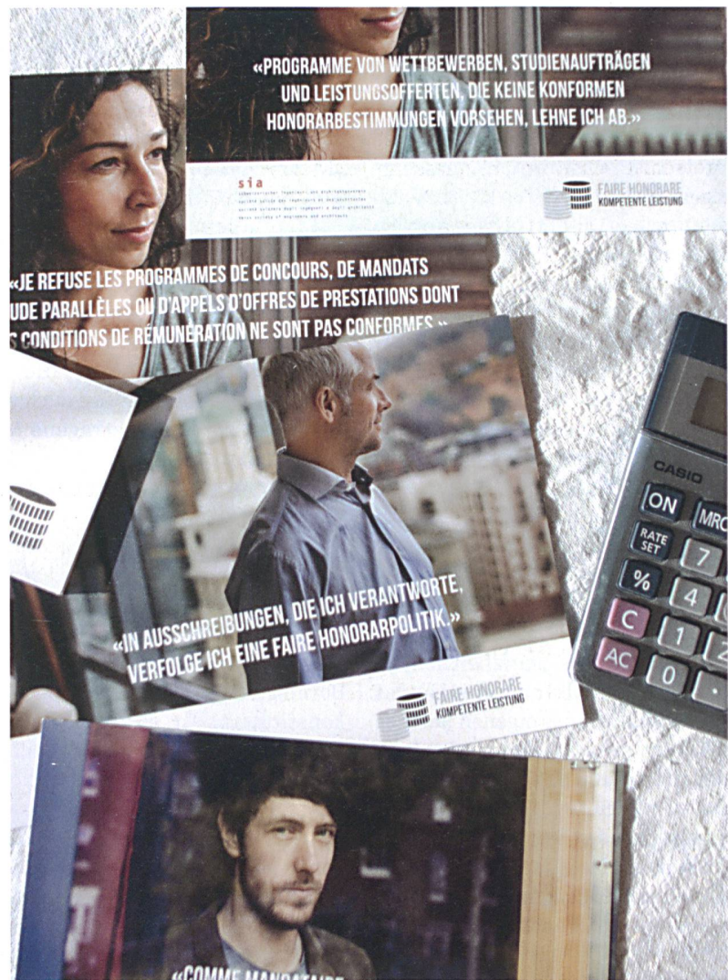
Postkartenmotive zur Charta, die der SIA im Frühjahr an seine Mitglieder versandt hatte.

kussion darüber hat im Kreise der SIA-Mitglieder auf jeden Fall wieder an Fahrt aufgenommen. Auch viele kleine sowie institutionelle Bauherrschaften und Auftraggeber haben reagiert, sowohl aus der Verwaltung als auch aus der Privatwirtschaft. Sie staunen auch über die mitunter