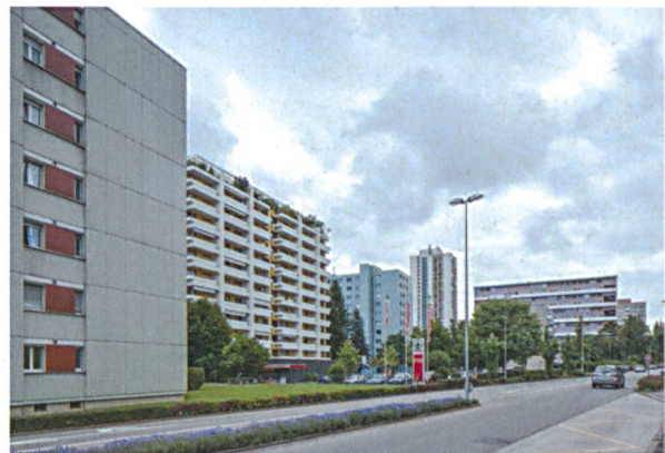
Le Corbusiers «Plan Voisin» (oben) aus dem Jahr 1925 zeigt das Zentrum von Paris, gestaltet nach den Prinzipien der Stadt der Moderne. Ein utopischer städtebaulicher Entwurf mit starkem Einfluss auf den Städtebau der Nachkriegszeit (unten). Aus einer avantgardistischen Vision wird letztlich die Realität der betonierten, flächendeckenden Agglomeration.