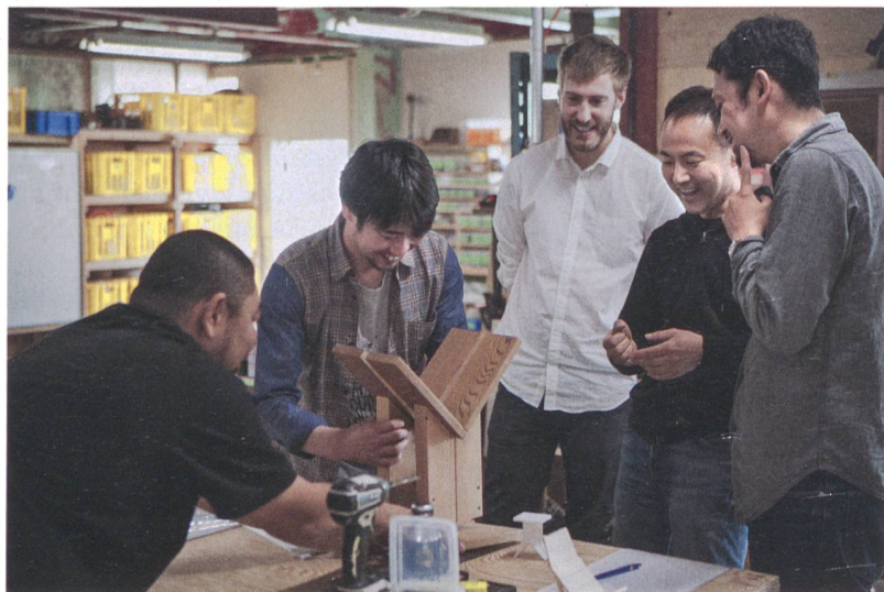
Holz verbindet japanische und schweizerische Designtradition – die Gestalter am Workshop in den Ishinomaki Laboratories.

Wogg und in Japan Ishinomaki Laboratories für die Zusammenarbeit gewonnen werden. Unser Motiv war zum einen sicherlich die Promotion von Schweizer Kompetenzen in Japan, genauso wichtig war uns zum andern aber auch der Austausch von Know-how über kulturelle Grenzen hinweg.