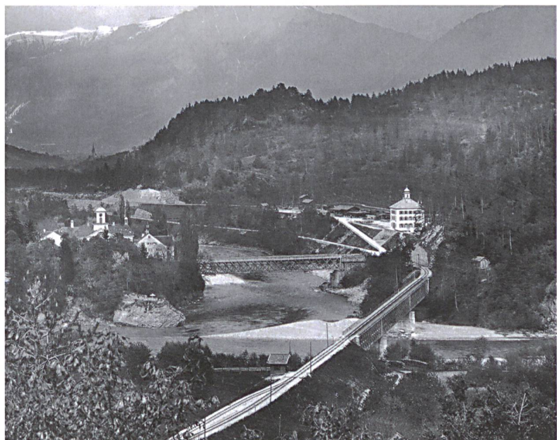
Am Zusammenfluss der beiden Rheine liegt der Weiler Reichenau GR mit seinen bauhistorisch wertvollen Brücken. Blick nach Osten um 1903.