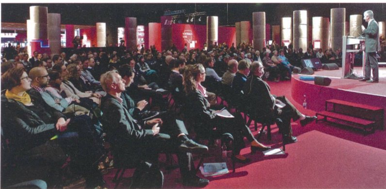
Gut besetzte Zuhörerreihen an einem Arena-Anlass des Swissbau Focus 2014.

D er SIA wirkt als Partner oder Mitveranstalter an einer Reihe von Vortragsanlässen und Diskussionsrunden der Swissbau mit (vgl. TEC21 45/2015, S. 19). Der wichtigste Abendanlass der Basler Messe, die am 12. Januar ihre Pforten öffnet, ist dabei sicher der «Architecture Theory Slam zur Baukultur», zu dem sich am Donnerstag, dem 14. Januar, ab 17.45 Uhr die bekannten Namen des Schweizer Architekturdiskurses in der Arena (Halle 1.0 Süd) versammeln.