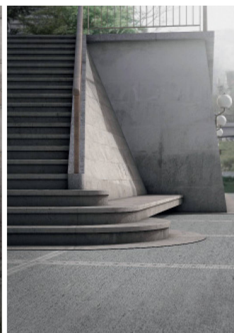
Visualisierungen: Enzo Valerio

per la Svizzera italiana, francese e tedesca (membri del comitato A&C). Ad ogni riunione della giuria partecipano un rappresentante del Gruppo professionale Architettura SIA e un rappresentante della Sezione SIA locale (Ticino, Vaud e Zurigo). La composizione e la continuità della giuria rendono possibile una visione globale di tutti i progetti di master consegnati nelle tre scuole superiori, considerando nel contempo i diversi approcci. Presso l'ETH di Zurigo sono assegnati ogni semestre tre temi a scelta. All'EPF di Losanna i temi e il programma sono sviluppati autonomamente dagli studenti. All'Accademia di architettura di Mendrisio si elabora in gruppo un argomento che poi verrà approfondito individualmente.