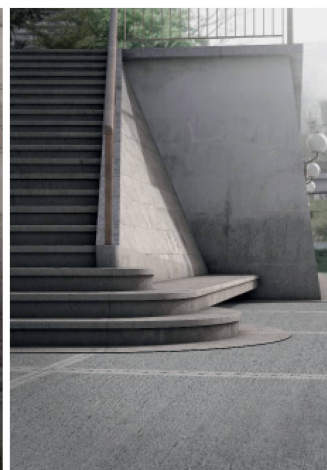
Visualisierungen: Enzo Valerio

per la Svizzera italiana, francese e tedesca (membri del comitato A&C). Ad ogni riunione della giuria partecipano un rappresentante del Gruppo professionale Architettura SIA e un rappresentante della Sezione SIA locale (Ticino, Vaud e Zurigo). La composizione e la continuità della giuria rendono possibile una visione globale di tutti i progetti di master consegnati nelle tre scuole superiori, considerando nel contempo i diversi approcci. Presso l'ETH di Zurigo sono assegnati ogni semestre tre temi a scelta. All'EPF di Losanna i temi e il programma sono sviluppati autonomamente dagli studenti. All'Accademia di architettura di Mendrisio si elabora in gruppo un argomento che poi verrà approfondito individualmente.