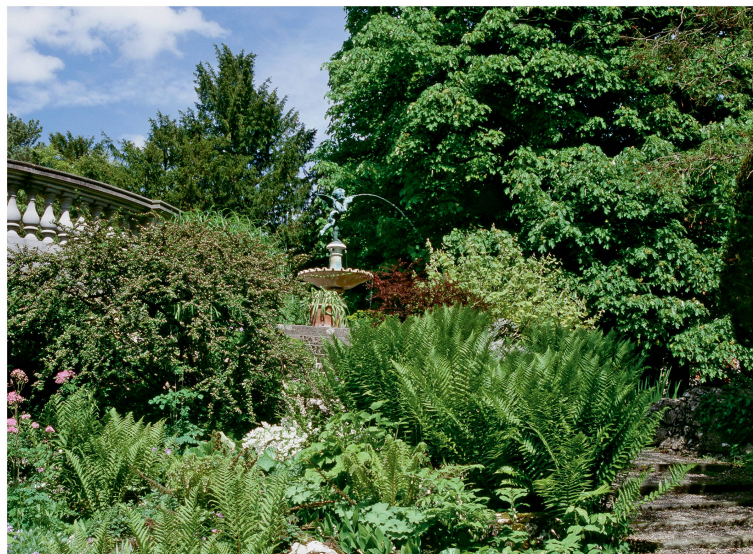
Der Park der Villa Bleuler in Zürich bewahrt viel Substanz aus dem 19. Jahrhundert.