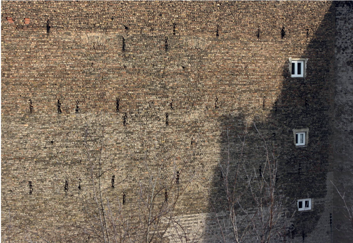
Schandfleck oder malerischer Anblick? Die unverputzte Brandmauer ist ein Beispiel, wie unterschiedlich wir Stadt wahrnehmen.

W ie beeinflusst der Charakter einer Stadt, ihre Räume, Bauwerke und Bilder, das Erleben des Menschen? Die in Städten wirksamen Interaktionsprozesse zwischen Mensch und Raum sind das Ergebnis komplexer Kopplungen zwischen menschlicher Wahrnehmung, subjektivem Raumerleben und seiner Aneignung und Nutzung. Das ist das Thema des Form-Kurses «Architektur und Psychologie».