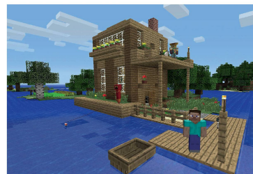
Minecraft: Die einfache Welt von Minecraft setzt sich aus verschiedenen Kosystemen zusammen.