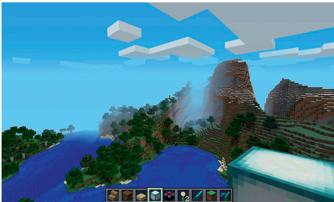
«Minecraft»: Innerhalb einer Tour in eine Richtung stösst der Spieler nach 60 Millionen Blocks oder rund 35 Stunden Realspielzeit an die Systemgrenze.

den. In Zusammenarbeit mit dem Designteam und der Grafik entwickelt ein Leveldesigner die Umwelt. Er entwirft Gestalt und Funktionen und ist für das Landschafts- und Gebäudedesign zuständig. Dazu muss er Aufgaben als Architekt, Landschafts- und Städteplaner erfüllen. Die Grafikabteilung setzt mit der Designidee die Charaktere und die Umwelt um und modelliert dazu die Objekte. Für die Figuren, Kreaturen und Gebäude fertigen 3-D-Artists mit Software, die auch in der Architekturvisualisierung zum Einsatz kommt, dreidimensionale Modelle an (vgl. «Frei im 3-D-Raum», S. 30). Die Abteilung Programmierung, oder in kleineren Firmen der Designer, setzt das Spiel technisch in eine funktionierende Software um. Die Benutzeroberfläche, die dem Spieler detaillierte Informationen über das Spielgeschehen gibt, erstellt der User-Interface-Designer mit der Programmierabteilung.