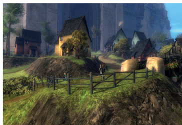
Guildwars 2: Im Spiel werden fünf humanoide Rassen, durch ihre eigene Architektursprache repräsentiert.