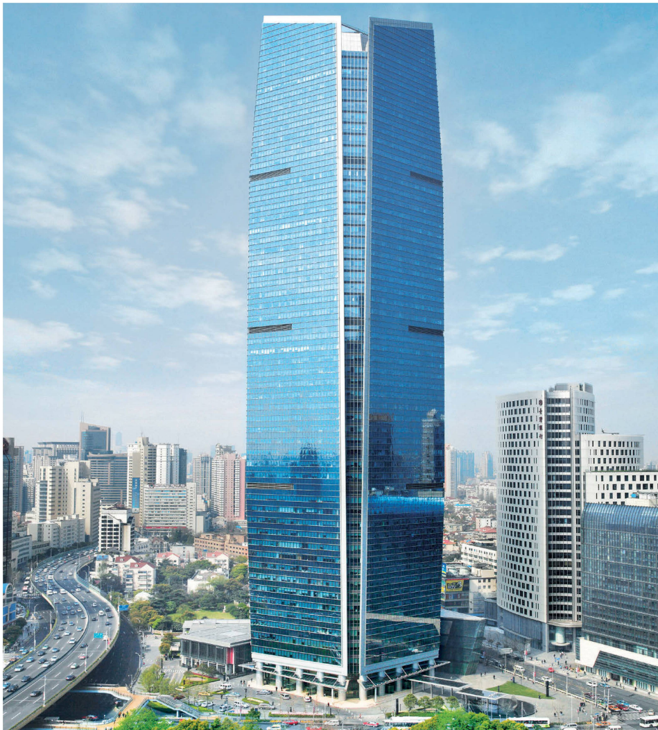
Wheelock Square, Shanghai