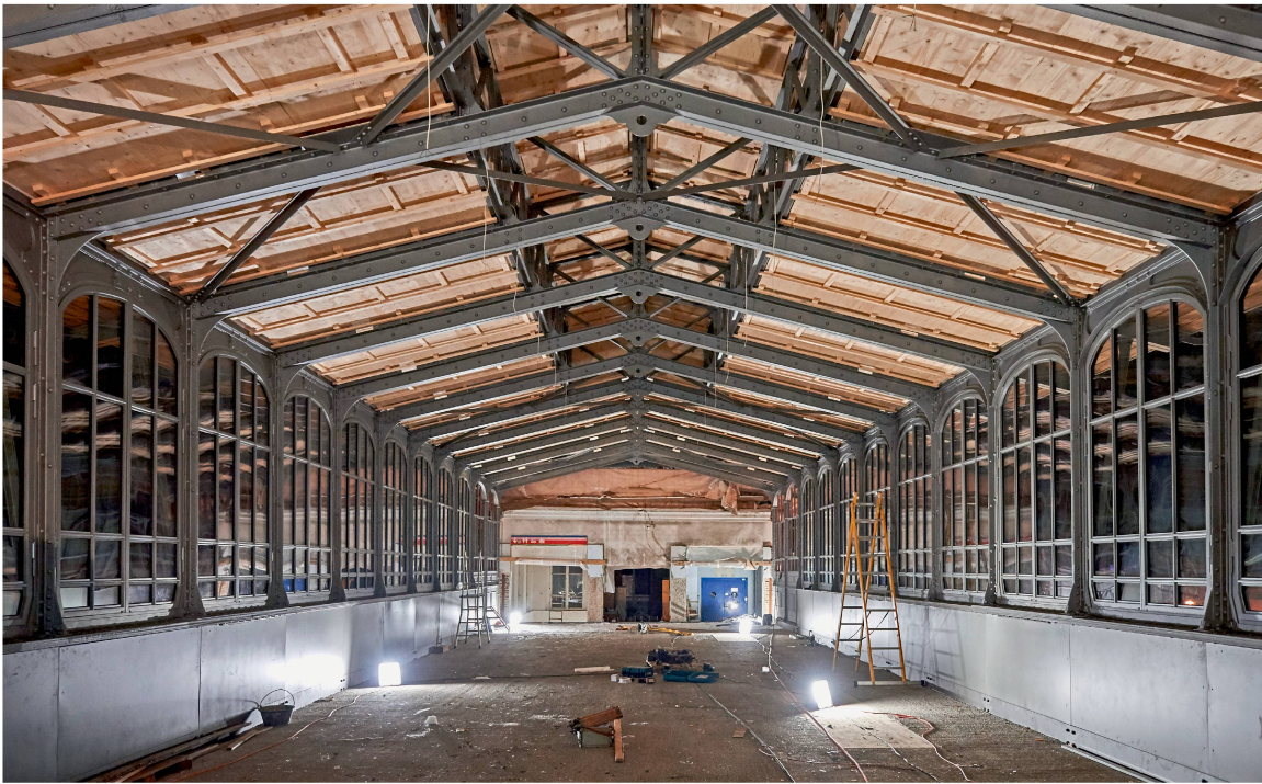
Das Tragwerk des Satteldachs mit dem im First aufgesetzten Oberlicht wurde nachträglich auf den Obergurt der Fachwerkträger gestellt. Es ist eine filigrane Stahlkonstruktion aus Zweigelenkrahmen. Windverbände steifen die Dachebene aus.

den Bahnbauten der Gotthardlinie bilden das Reitergebäude des Hochperrons und das turmartige Stationsgebäude ein Ensemble von besonderem technikkund- und kulturgeschichtlichem Wert und von nationaler Bedeutung. Insbesondere das Tragwerk ist ein beeindruckendes