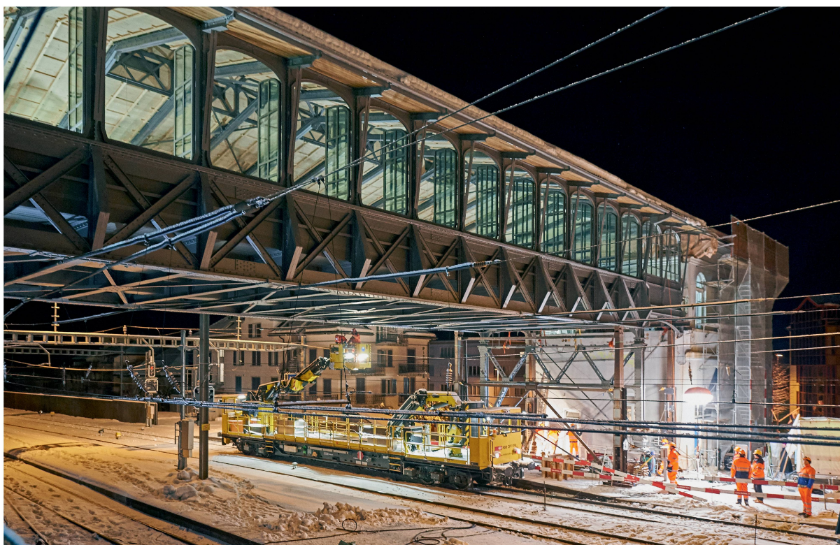
Der Hochperron der Arth-Rigi-Bahn in Goldau , einem Reitergebäude über den Gleisen der SBB-Linie Luzern–Lugano bzw. der Gotthardbahn. Seit Februar 2015 steht er angehoben, aber in der originalen Stahlkonstruktion um 72 cm erhöht auf neuen Auflagern.

Der Kopfbahnhof der Arth-Rigi-Bahn in Goldau ist bezüglich Situation und Stahlbauweise schweizweit einmalig. Er wurde 1897 gebaut, nachdem der Keilbahnhof Arth-Goldau ein Aufnahmegebäude erhalten hatte und die Gleise der Rigibahnen neu geführt werden mussten. Rechtwinklig als Reitergebäude überspannt er seither die SBB-Gleise nach Luzern am westlichen Ende des Bahnhofs mit einer markanten und für seine Zeit fort-