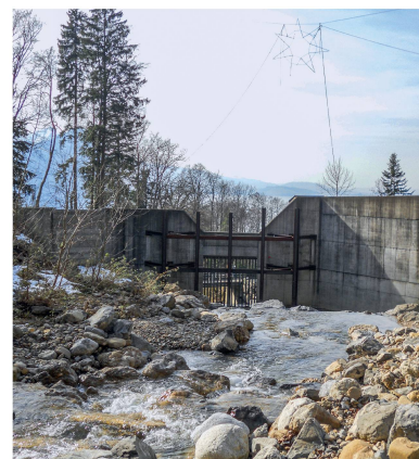
Geschiebesammler im Einzugsgebiet des Altdorfbachs in Vitznau. Seine Kapazität vermag lediglich das Material eines Murgangereignisses mit Wiederkehrdauer von 30 Jahren aufzunehmen.

haben. Unzählige spontane Wasseraustritte führten auch im Wald zu Rutschungen. «Wir schenken den Rutschprozessen heute viel mehr Aufmerksamkeit als früher», sagt Silvio Covi, der als Schutzwaldbeauftragter des Kantons die Luzerner Rigigemeinden seit 28 Jahren betreut. Die Begehungen nach dem Unwetter hätten gezeigt, dass die Bäume im grossflächig wirksamen Schutzwald riesige Mengen an Erdmaterial, Steinblöcken und Holz effizient aufzuhalten vermochten.