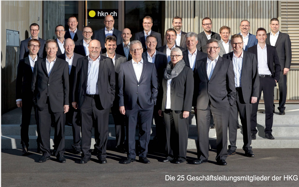
Die 25 Geschäftsleitungsmitglieder der HKG