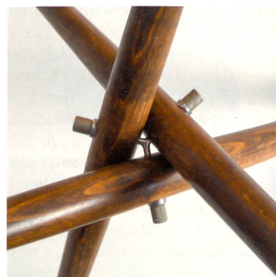
Hans Bellmanns Kolonialtisch, der aus einer Wette heraus entstand. Im Detail das Verbindungsstück des Dreibeins. Aus dem Archiv von Designunddesign in Baden.

gewerbeschule Zürich und der Hochschule für Gestaltung in Ulm tätig. Diese erste Monografie stellt die Arbeit von Hans Bellmann detailliert vor mit einem einordnenden Essay sowie vielen neu erstellten Fotografien und Texten zu den einzelnen Objekten.