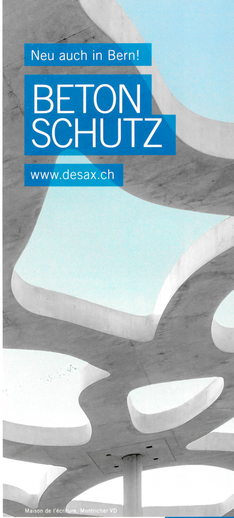
Maison de l'écriture, Montricher VD

Graffitischutz Betonschutz Desax Betonkosmetik Betongestaltung Betonreinigung