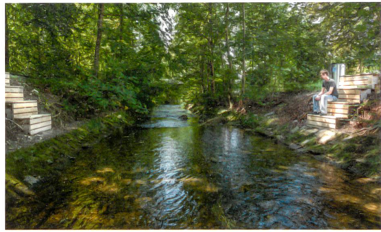
Unbekannte Räume entdecken: Sitzstufen am Wildbach.

Was genau macht diese Räume der Alltagserholung aus? Oft handelt es sich um beiläufig erscheinende, eher kleine Flächen: Eine Sitzbank an einem Aussichtspunkt, ein Weg durch eine ansprechende Topografie, Tisch und Bank unter einer markanten Baumgruppe, ein Denkmal, das an die Geschichte eines Orts erinnert – meist reicht wenig, um Erholungsuchenden eine Auszeit vom Alltag zu ermöglichen. Das wichtigste Merkmal der Räume ist ihre Unbestimmtheit: Sie bieten keine Freizeitbeschäftigung an, indem sie ihre Besucher mit einem nutzungsorientierten Angebot vom Alltag ablenken. Vielmehr ermöglichen sie Entspannung, ohne Aktionen einzufordern.