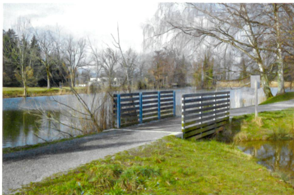
Am Anfang stand der Naturschutz, die Erholung kam später dazu.

spielsweise auf das Zürichseeufer, den Uetliberg oder die landschaftlich ansprechende Tössegg. Die Räume dazwischen bleiben hingegen mehrheitlich unbeachtet. Zudem birgt deren Lage in Landwirtschaftszonen oder in Naturschutzgebieten oft Potenzial für Nutzungskonflikte: Hier gilt Erholung eher als störend denn als bereichernd.