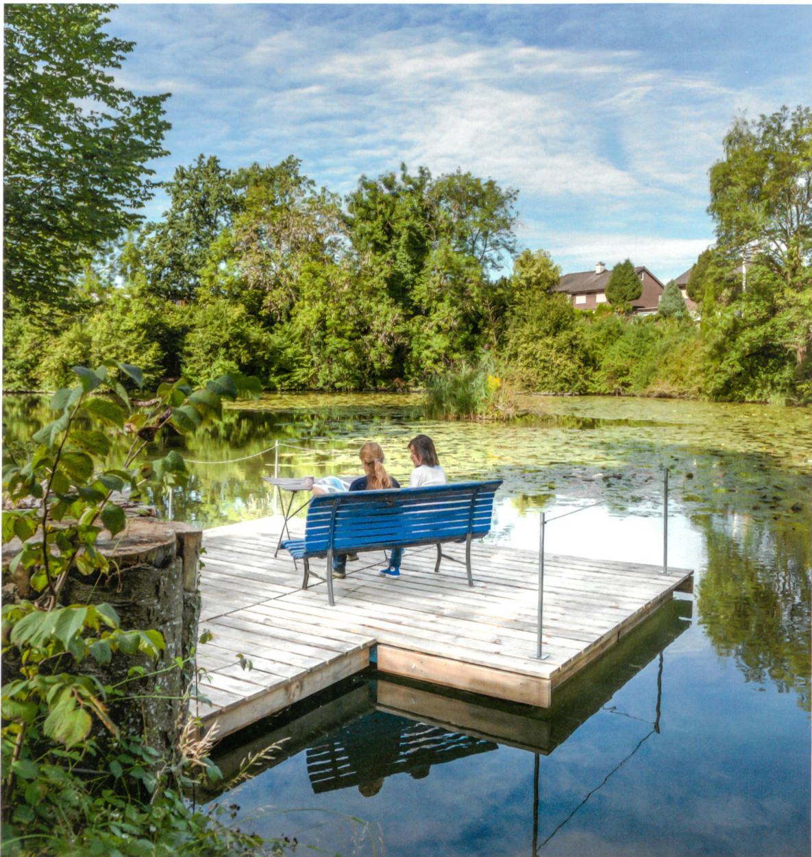
Kleiner Eingriff mit grosser Wirkung: Der neue Steg in Wetzikon eröffnet eine veränderte Perspektive auf die Landschaft.