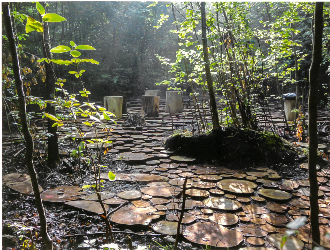
Die Gestaltung des Bodens macht aus der Lichtung einen Platz.

WILDWOOD PLAZA, HEGETSBERGSTRASSE, FORHÖLZLIWALD, USTER Planungsbüro: Robin Winogron Landscapsarchitekten, Zürich (heute: Studio Vulkan Landscapsarchitektur, Zürich) Auftraggeber: Stadt Uster, Bauamt Planung: 2012 Realisierung: 2014