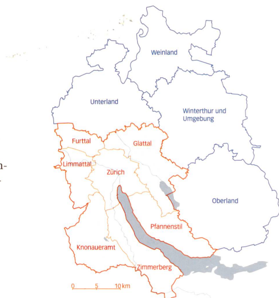
Das Gebiet der RZU im Kern des Zürcher Metropolitanraums (Darstellung mit Kantonsgrenzen).

Es war ganz wesentlich eine inhaltliche Motivation, die mich zum Wechsel bewogen hat. Über die letzten Jahre haben mich immer mehr Fragen der