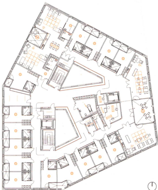
Alterszentrum Appenzell, Grundriss 3. OG, Mst. ca. 1:750 mit dynamischen Lichtdecken in den Aufenthaltsräumen (rechts), in der Pflegeoase (links) sowie dynamischen Einzeleuchten im Stationszimmer (Mitte).

Plan: Bob Gysin + Partner BGP, Architekten ETH SIA BSA/Reflexion