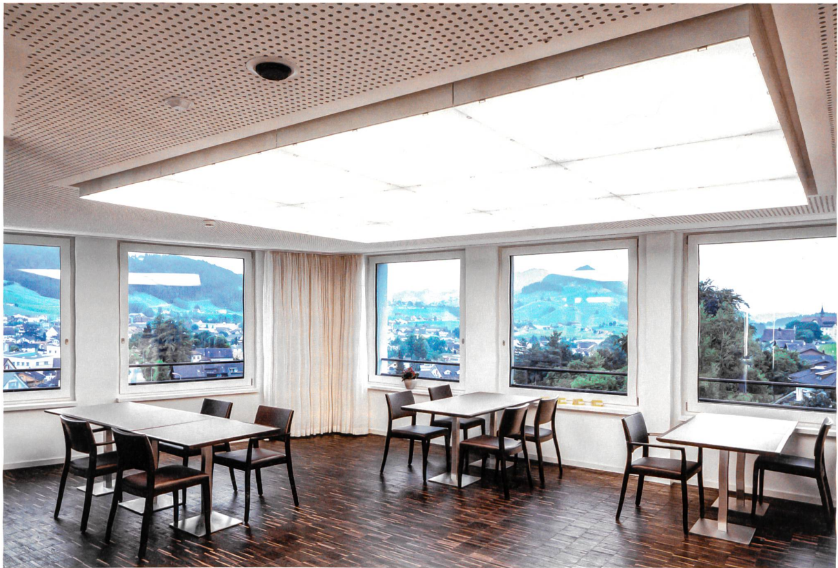
Aufenthaltsraum im neuen Alterszentrum Appenzell mit dynamischer Lichtdecke (Architektur: Bob Gysin + Partner BGP, Zürich; Lichtplanung: Reflexion, Zürich). Für das gleiche Sehergebnis benötigt ein 60-Jähriger die zwei- bis dreifache Menge an Licht wie ein gesunder 20-Jähriger, ein 80-Jähriger bereits das Vierfache.

Plan: Bob Gysin + Partner BGP, Architekten ETH SIA BSA/Reflexion