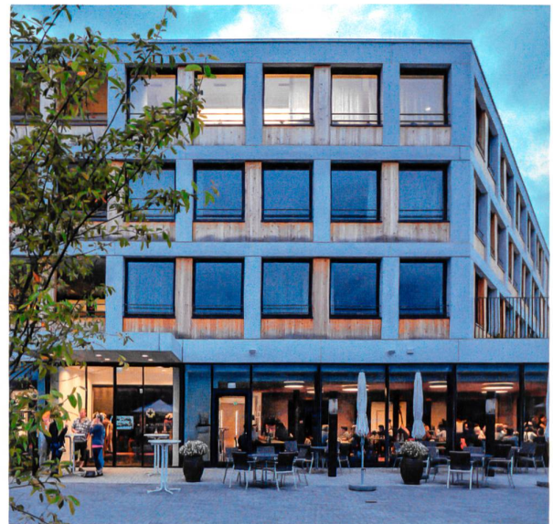
Aussenansicht des Alterszentrums Appenzell. Im obersten Geschoss gut erkennbar ist die dynamische Lichtdecke. Die Lichtdecken in den Aufenthaltsräumen werden über Bewegungsmelder aktiviert.