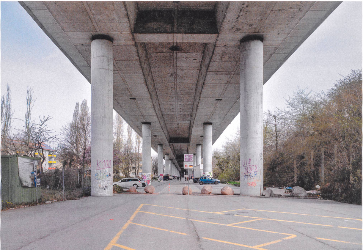
Die Dreiländerbrücke (oberes Bild) verbindet die französische und die deutsche Seite; im Hintergrund der Rheinhafen Basel-Klein- / hünigen und die Westquaiinsel. Der Grenzpunkt des Dreiländerecks befindet sich mitten im Fluss zwischen Brücke und Rheinhafen. Die Fußgänger- und Fahrradbrücke zwischen Hüniguingue und Weil am Rhein wurde 2007 eröffnet. Unteres Bild: Andernorts verläuft die Grenze mitten im Stadtraum , etwa direkt unter der Autobahn in unmittelbarer Nachbarschaft eines Wohngebiets.