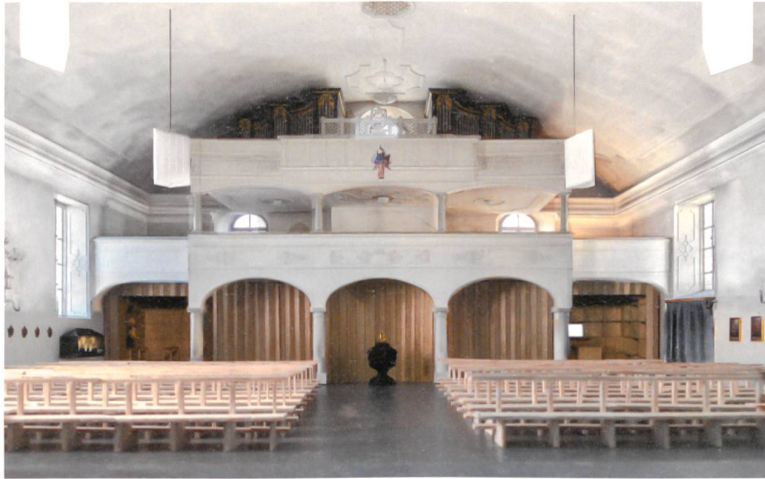
Das Siegerprojekt «Passepartout» klärt die Westseite mit einem raumbildenden Einbau aus Holzlamellen.