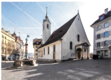
Die Peterskapelle zwischen Kapellbrücke und Kapellplatz ist die älteste Kirche auf Luzerner Stadtgebiet.

Die umgekehrte Richtung, eine Hinwendung zu einer eher irdischen Anwendung, versuchten mehrere Projekte, so «Wabi-sabi» von Romero & Schaeffle Architekten, Zürich (ausgeschieden), der den Raum sehr schön klärte, aber mit