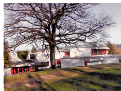
In Raumdisposition und Materialisierung ist die Schule ein typischer Vertreter der 1970er-Jahre.

Wenig überraschend finden sich auf den Rängen die beiden Extreme: Lauener Baer Architekten kamen auf den ersten Platz mit einer Lösung, in der die gesamte Schulanlage erhalten bleibt und ein neuer Trakt die Anlage ergänzt. Nägele Twerenbold auf dem dritten Rang verfolgten den gleichen Ansatz. Auf dem zweiten Platz landete das Projekt von Waeber/Dickenmann mit einem kompletten Neubau. Die weiteren, nicht rangierten Projekte zeigen die Schattierungen dazwischen: von einer anregenden, aber kaum umsetzbaren Weiterführung der ursprünglichen Entwurfsmethode (hug Architekten) bis zu einem partiellen Ersatz einzelner Trakte durch Neubauten (Burkhard Meyer Partner sowie Aschwanden Schürer).