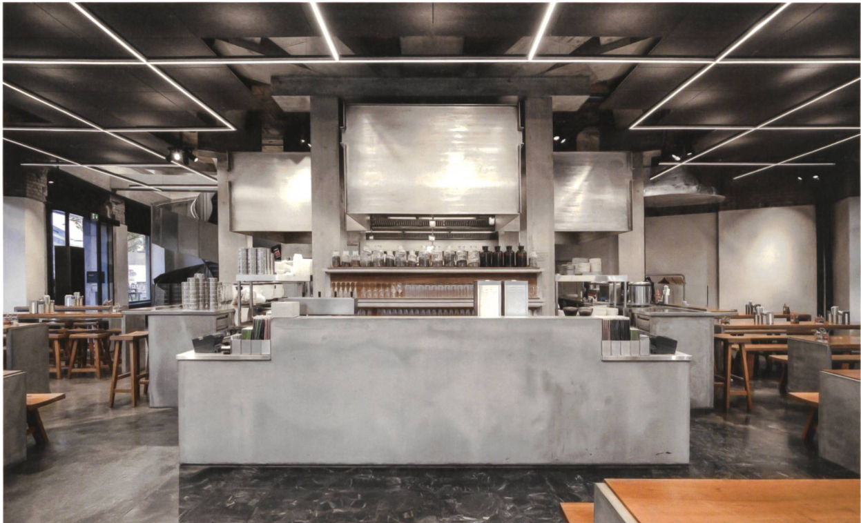
Die Küche bildet den Motor im Zentrum. Wie eine Papierlaterne ist der Dunstabzug zwischen den tragenden Säulen eingefügt.

S o wie das Gelingen eines Fonds die Verwendung weniger, aber bester Ingredienzen voraussetzt, misst sich die Qualität eines Raums am Einsatz der baulichen Mittel – hier wie da führt Reduktion zum besten Ergebnis. Das Ladenlokal liegt im hohen Erdgeschoss eines trutzigen Gründerzeithauses, dessen runder Bug eine Blockbebauung abschliesst. Die denkmalgeschützte Fassade ist hier durch grosse Fensterquadrate rhythmisiert, sodass das Tageslicht von drei Seiten hineinscheinen kann (vgl. Isometrie).