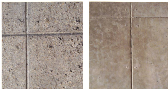
Sichtbetonoberflächen innen und aussen am Carpenter Center, USA, errichtet von Le Corbusier 1961–1963.

Auf den Spuren von drei Meistern ihres Fachs geht Autor Martin Lehnen den Ursachen für die Oberflächengestaltung von Sichtbeton auf den Grund. Während bei den betrachteten Werken von Le Corbusier und Kahn die Herstellungsprozesse auf der Betonoberfläche abgebildet werden, liegt Tadao Andō Arbeit bereits ein baukünstlerisches Konzept zugrunde, das sich nicht mehr an den technischen Vorgaben orientiert, sondern Form und Lage von Ankerlöchern und Schalungsfugen eine unabhängige dekorative Bedeutung einräumt. Solcherart detailverliebte Studien sind es, die im Umfeld von Architekten ratloses Kopfschütteln auslösen. Für Interessierte ist diese vergleichende Studie aber aufgrund der umfassenden Recherche in technischer und künstlerischer Hinsicht ein Gewinn. Und schöne Bilder gibt es auch. •