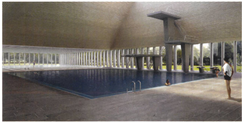
3. Preis «E la nave va»: funktionale Konstruktion mit Stützen und Kassettendecke.

Das drittrangierte Projekt «E la nave va» überzeugt durch die klare Setzung der Volumen. Schwimmsportzentrum und Unterkünfte besetzen den Süden und Norden des Baufelds. Die Sporthalle liegt ausserhalb, im Norden des Wettbewerbsperimeters. Das Schwimmsportzentrum ist eingezwängt zwischen dem Naturschutzgebiet und der Kreuzung der Baumalleen. Leicht abgehoben steht es auf einem brüstungshohen Sockel. Das enge Stützenraster in Sichtbeton korrespondiert mit der Kassettendecke über dem Schwimmbecken. Über dem Sprungbecken ist die Decke als Pyramidenstumpf ausgebildet, der von oben belichtet ist. Fassaden und Dachflächenfenster lassen sich öffnen. Die insgesamt gute Disposition der Gebäude, die Funktionalität und die betrieblichen Abläufe des Projekts überzeugen. Nicht aber die Positionierung und die aufwendige Etappierung. Die Qualitäten des Beitrags liegen in der