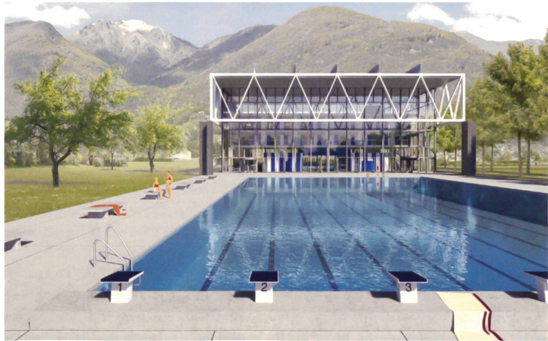
1. Preis «Rimini»: leichtes Fachwerk mit Fernwirkung.

Die Rahmenbedingungen waren sehr restriktiv. Für die verschiedenen Nutzungen wurde ein Baufeld im nordwestlichen Teil des Areals in unmittelbarer Nähe des Naturschutzgebietes Bolla del Naviglio und dem angrenzenden Wohngebiet ausgeschrieben. Die Sporthalle konnte auch ausserhalb des Baufelds im nördlichen Teil des Perimeters angeordnet werden. Eine weitere Knacknuss war der Wunsch