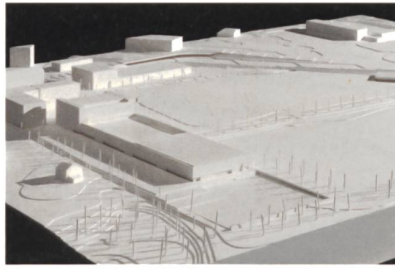
2. Preis «Campus».