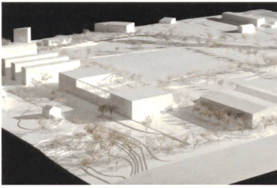
1. Preis «Rimini».