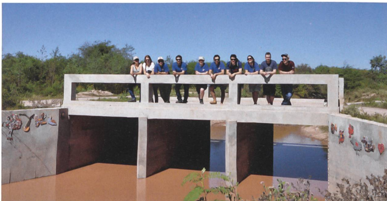
Mitglieder von Ingenieure ohne Grenzen auf der grösseren der beiden Brücken, die sie in Colonia Dora bauten. Dieses Bild entstand im Frühling 2015 bei Beginn des nächsten Projekts in der Region.