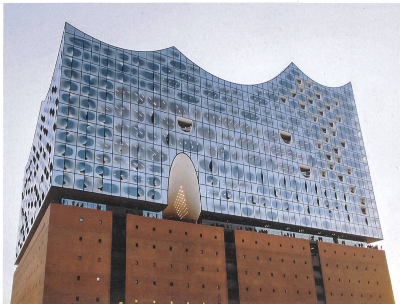
Die Elbphilharmonie, das jüngst eröffnete Hamburger Wahrzeichen, wurde durch digital gestützte Prozesse erstellt.

Weitere Informationen und Anmeldung unter www.sia.ch/bgt oder www.bauen-digital.ch