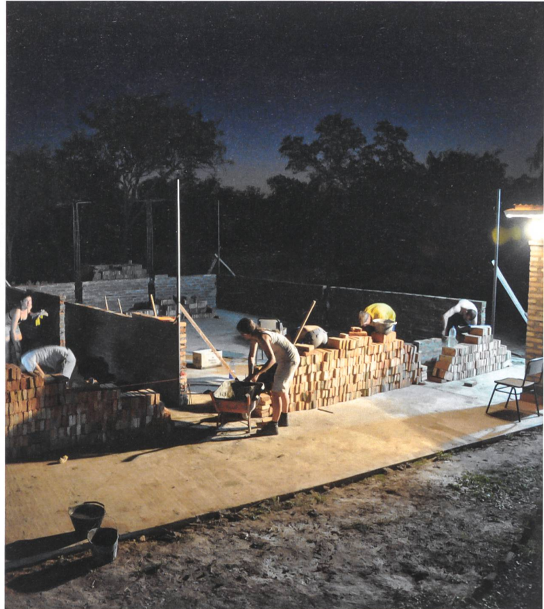
Freiwillige und Mitglieder von Ingenieure ohne Grenzen, die im Frühjahr 2015 beim Bau des Schulhauses die letzten Mauersteine des Tages setzen.

Dass dafür vor Ort oft unkonventionelle Ansätze angewendet werden müssen, empfinden die beiden