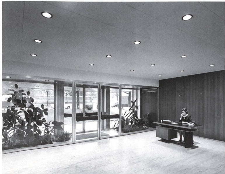
Eingangsbereich des ehemaligen Wiener Firmensitzes von Hoffmann-La Roche . Nach seiner Neugestaltung wird das Gebäude als Hotel genutzt.