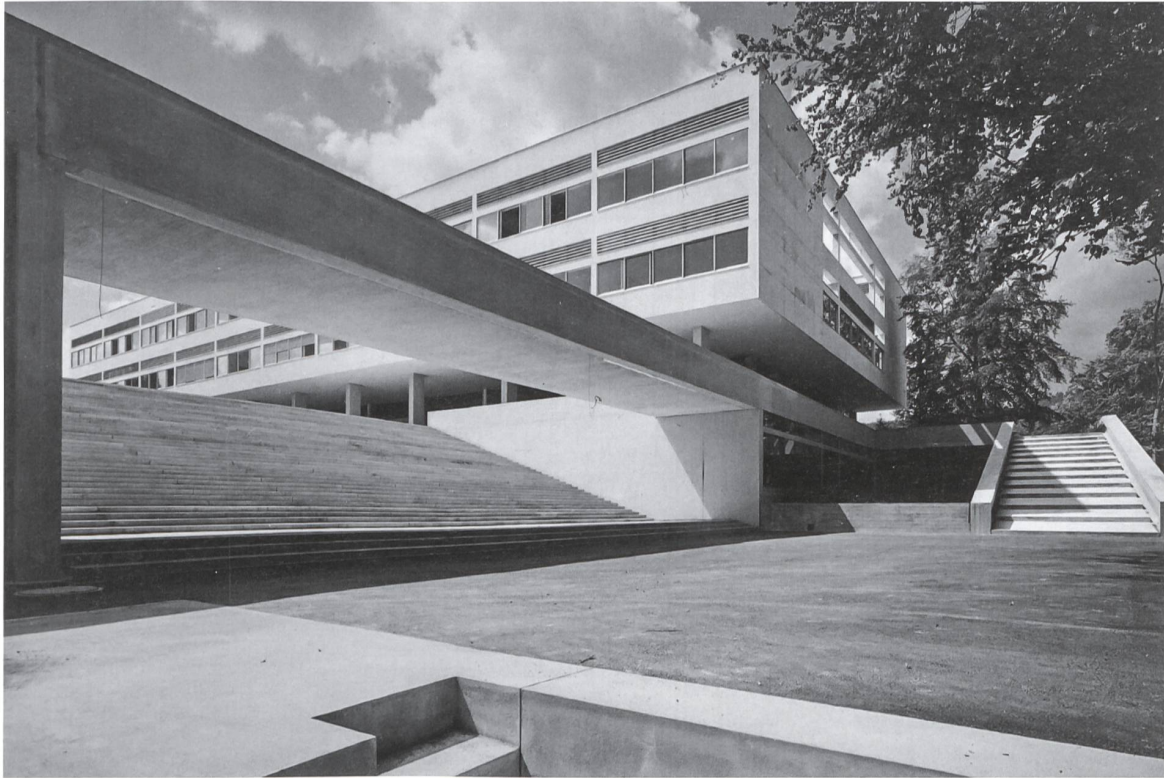
Schaders Hauptwerk, die Kantonsschule Freudenberg in Zürich, gilt als Manifest des Aufbruchs in den 1960er-Jahren.

F ilme der Nouvelle Vague aus den 1960er-Jahren werden als Klassiker verehrt. Oldtimerautos werden gehegt und gepflegt. Während Möbel, Mode, Musik, Literatur und Kunst der Nachkriegszeit heute als kulturelle Zeitzeugnisse geschätzt werden, erhält die Architektur jener Epoche erst zögerlich eine angemessene Wertschätzung. Es fehlt am Verständnis in der Bevölkerung und an Vermittlungsarbeit vonseiten der Fachleute.