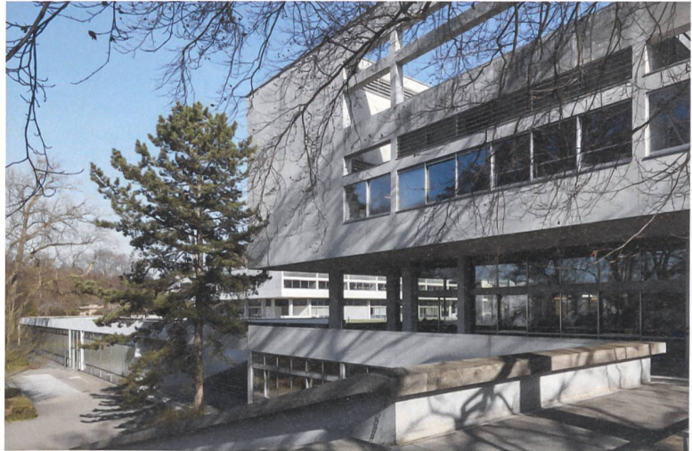
Die Schulanlage heute: im Vordergrund die Kantonsschule Enge, im Hintergrund die Kantonsschule Freudenberg.

Zwei miteinander verknüpfte architektonische Themen charakterisieren den Entwurf: das Raumkontinuum und die Transparenz. Die zusammenhängende Struktur, das Verbinden der Trakte und Räume, das ständige Weiterleiten in der Wegführung, die Sichtbezüge namentlich über die Hallen und Treppen hinweg schaffen eine allumfassende räumliche Kontinuität. Die Durchdringung der Gebäudehülle, die Auflösung ganzer Raumfronten und das Spiel mit durchsichtigen