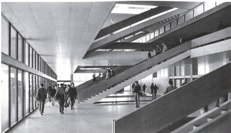
Räumliche Kontinuität und Transparenz kennzeichnen das Innere der Schule.