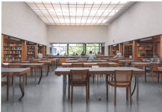
Der Lesesaal in der Schweizerischen Nationalbibliothek ist ein innenarchitektonisches Gesamtkunstwerk.

W elcher Ort könnte geeigneter sein, um das diesjährige Thema des Schweizer World Interiors Day zu verkörpern? Die Nationalbibliothek in Bern steht mit ihren forschenden Nutzern für den Ausblick in die Zukunft, wie ihn im Rahmen der Veranstaltung auch die Schweizer Hochschulen geboten haben, die frische Projekte von Studierenden ausstellten und erläuterten.