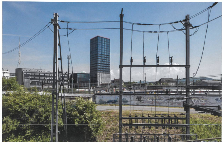
Der 22-geschossige Grosspeter Tower in Basel ragt hinter den SBB-Gleisen 78 m in die Höhe.