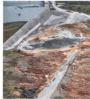
Luftansicht der erodierten Landschaft unterhalb des Dammüberlaufs.

Dass es beim Betrieb der Hochwasser-Notentlastung zu Erosionen und Schäden kommt, wird bewusst in Kauf genommen, handelt es sich doch um eine zweite Sicherungsmassnahme im Sinn einer Ultima Ratio. Um diesen Erosionsprozess in Grenzen halten zu können,