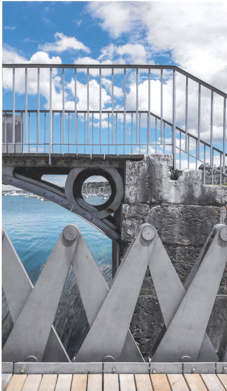
Detail der Scherenkonstruktion der neuen Brücke in Genf. Im abgesenkten Zustand ermöglicht die Brücke einen barrierefreien Zugang zum Jet d’Eau.

Der Jury des 2. Building-Awards war diese originelle Lösung des uralten Problems der Kreuzung zweier Verkehrswege sowohl den Sieg in der Kategorie Infrastrukturbau als auch den Gesamtpreis wert. Die Idee des Building-Awards, Ingenieurleistungen in der Öffentlichkeit besser wahrnehmbar zu machen, ihnen einen gebührenden Stellenwert zukommen zu lassen und junge Menschen für eine Ingenieurkarriere zu begeistern, wird durch das Projekt prägnant verkörpert. Lässt die Umsetzung der Brücke doch nicht nur die trockene Theorie erahnen, die solch ein Bauwerk erfordert, sondern zeigt auch eine gewisse spielerische Leichtigkeit und die Lust am Austüfteln von Problemlösungen.