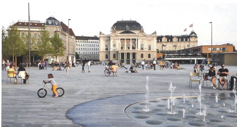
Am Tagungsort: der nach Plänen der Landschaftsarchitekten vetschpartner umgestaltete Sechseläutenplatz in Zürich.

Wann: 21. 9. 2017, 9.15–17.00 Uhr Wo: Sechseläutenplatz 10, Zürich (Brasserie Schiller und Hauptsitz der NZZ). Kosten: SIA-Mitglieder 100 Fr., Nichtmitglieder 200 Fr. Info und Anmeldung: www.sia.ch/mehralsgestaltung