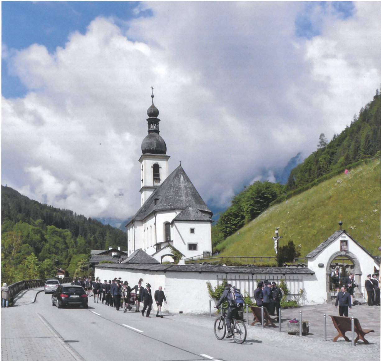
Die Ramsauer Barockkirche St. Sebastian ist eines der meistfotografierten Sujets im Alpenraum. Das Bergsteigerdorf bemüht sich aber darum, die Bedürfnisse der Bevölkerung denjenigen des Tourismus voranzustellen.