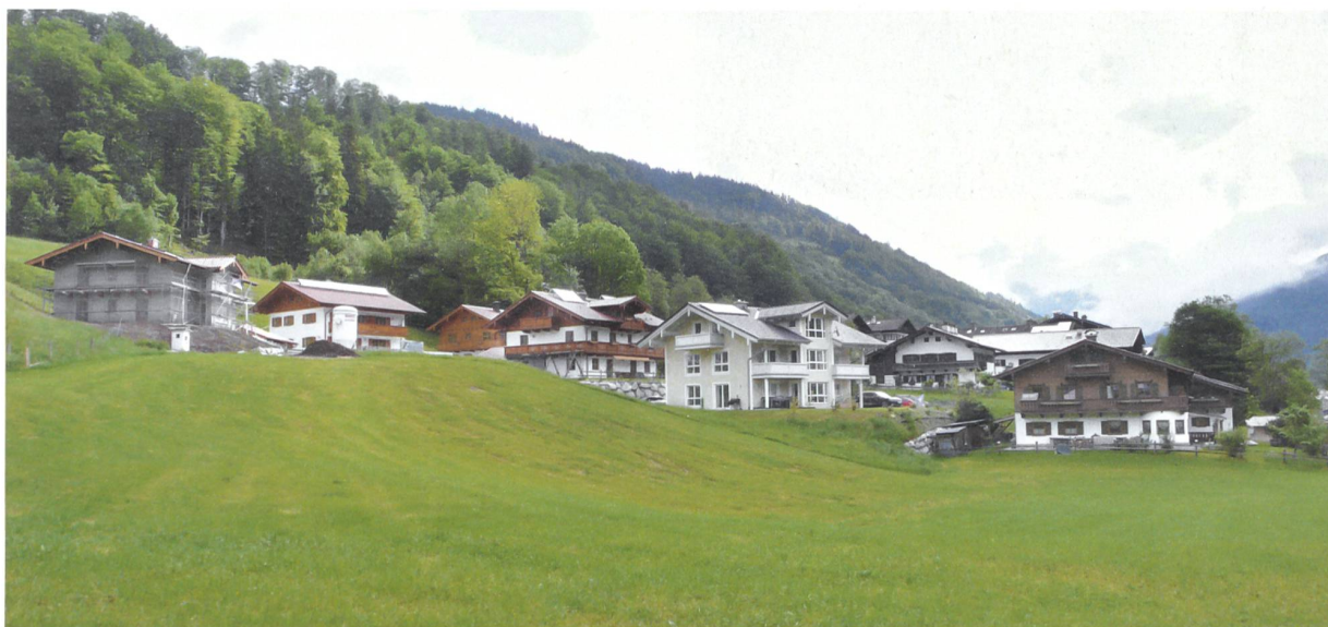
Bergsteigerdörfer zeichnen sich durch eine überschaubare Entwicklung und eine funktionierende Versorgungsstruktur aus (Blick auf den Ramsauer Ortsteil Am Forstamt).