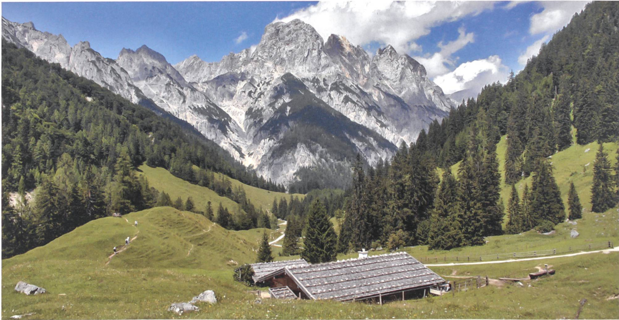
Ansicht auf Bindalm und Mühlsturzhörner: Die Wildnis im Nationalpark und die Gastfreundschaft der benachbarten Alpbetriebe sind wichtige Anziehungspunkte für die vielen Wandertouristen.

rischen Alpenclub ergeben. Acht weitere, alpinistisch herausragende Kandidaten wie Saas-Fee oder Grindelwald stehen auf der SAC-internen Liste. Allerdings hat der Alpenclub selbst Bedenken, dass alle die Kriterien erfüllen. Und zudem will der Bergsportverein prüfen, ob eine institutionell und thematisch breiter abgestützte Trägerschaft organisiert werden kann.