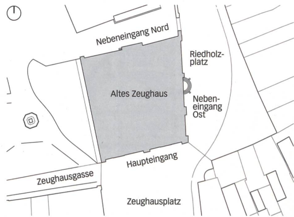
Situation zwischen Zeughaus- und Riedholzplatz, Mst. 1:2000.

In der Schweiz gibt es über 1000 Museen. Keines ist wie das andere; aber alle warten auf interessierte, neugierige Besucher. Die bekanntesten präsentieren bildende Kunst und locken Publikum aus nah und fern. Zur Positionierung werden jedoch schnell ändernde Inhalte benötigt; möglichst spektakuläre Neubauten machen zusätzlich auf sich aufmerksam (vgl. TEC21 45/2016). Der Aufwand, den die öffentliche Hand und private Mäzene dafür betreiben, ist enorm. Die Investitionen dienen ebenso dem Standortmarketing wie der Förderung von Kunst und Baukultur. Daraus ergeben sich bisweilen leider abgehoben wirkende Objekte, die