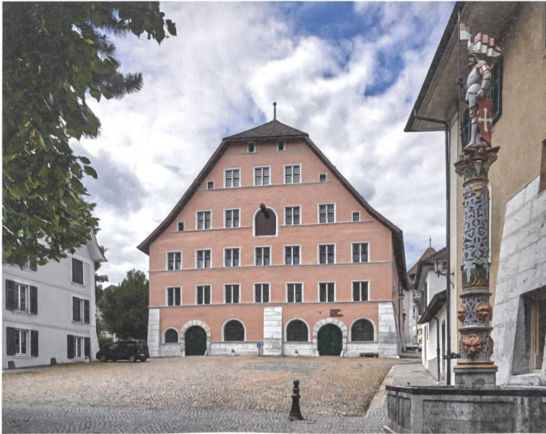
Blick auf das Alte Zeughaus mitten in der Solothurner Altstadt.