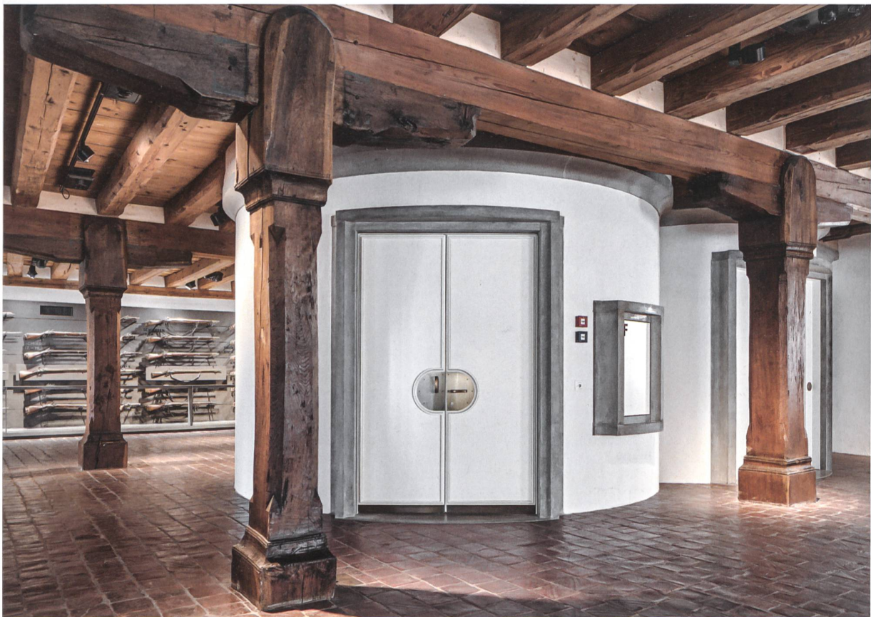
Altes Zeughaus Solothurn: der Erschliessungsturm als interner Neuling und dahinter die Waffenwand (2. Ausstellungsgeschoss).

Eine Halbarte ist eine Halbarte ist eine Halbarte. Die lange Holzstange hält Gegner auf sichere Distanz; die vorn angebrachte Rundklinge mit Hacken, Dorn und Spitze erlaubt wilde, verbissene Attacken. Die «Hellebarde» gehörte zur Standardausrüstung der kriegerischen und tapferen Eidgenossen. Im Zeughaus lagern weit über 400 Stück, weil Solothurn lange Zeit die Söldner-