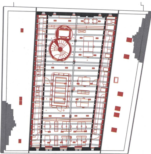
Grundrisse 3. OG: Raum für Wechselausstellungen.