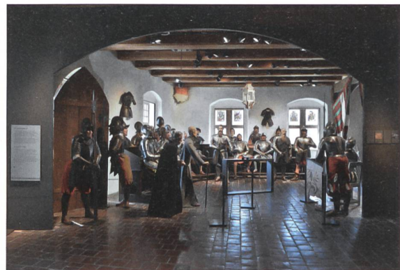
Mit Puppen inszenierte Tagsatzung von Stans.