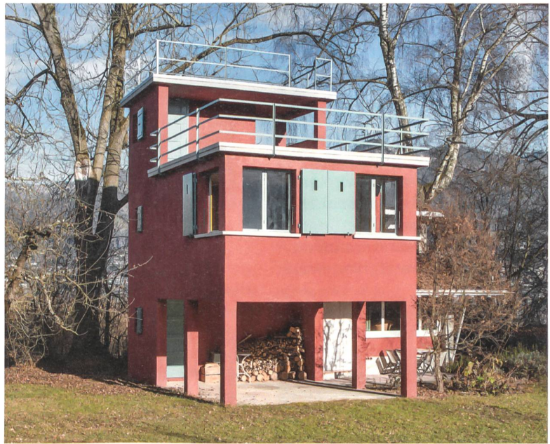
Mit dem Rücken zum See wendet sich das Badhaus der Wiese zu. Rechts der versteckte Anbau der 1950er-Jahre, den die Auszeichnung mit einschliesst.

Das Badehaus ist als ein «Zwitter» im Übergang vom behäbigen zum zukunftsorientierten Bauen zu betrachten. Durch seine einfache Funktion steht es inhaltlich noch im Einklang mit der Reformbewegung des frühen 20. Jahrhunderts, deren Bauten einem traditionellen Baustil mit Satteldach oder aufrechten Fenstern verbunden waren. Gestalterisch hingegen ist es bereits von den Parametern des Neuen Bauens geprägt. Die konstruktiven Materialien wie Beton und Stahlbänder sind sichtbar und funktional verwendet. Zusammen mit der kubischen Formensprache und der ausdrucksvollen Farbgestaltung erhebt es einen baukünstlerischen Anspruch. Wie der Enkel des Architekten berichtet, hatte Wipf seinerzeit die Weissenhofsiedlung in Stuttgart besucht und zunächst geringschät-