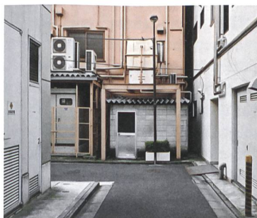
Darf's ein bisschen mehr sein? Haustechnik in Tokio.

Trotz der Vorzüge der technischen und digitalen Unterstützung stösst deren Anwendung immer noch oder wieder vermehrt auf Vorbehalte: allgemeine Skepsis gegenüber der Technisierung, gepaart mit einer Ablehnung jeglicher Fremdbestimmung. Es gibt aber auch ganz konkrete Befürchtungen, ob die Anlagen und Systeme aufgrund ihrer unterschiedlichen Lebenszyklen langfristig tauglich sind. Ist es tatsächlich möglich und praktikabel, alle Komponenten vorzeitig