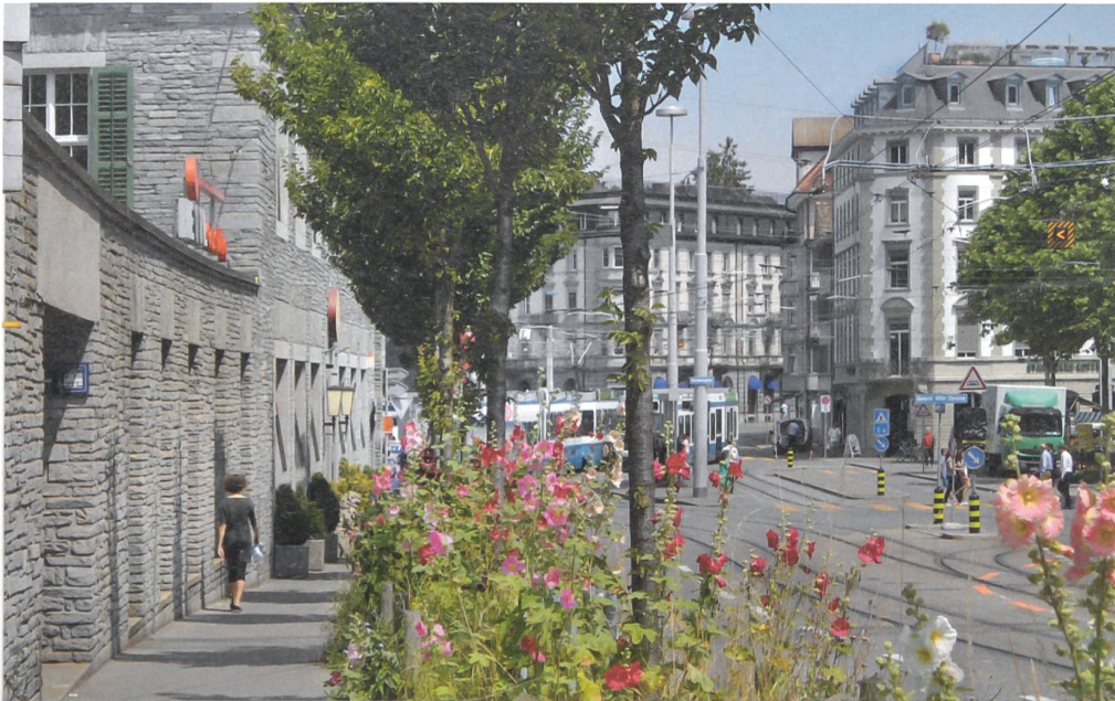
Malvenblüte auf den Baumscheiben vor dem Bahnhof Enge in Zürich, 2014.

stand er auch dafür ein, unter der Devise «Alle brauchen Gärten!» «Gärten in Massen» bereitzustellen. Er schenkte dem Kleinen ebenso viel Aufmerksamkeit wie dem Grossen. Heute sind die grünen Keimzellen noch kleinteiliger: Im omnipräsenten Wachsen und Wuchern von Dächern und Balkonen, bepflanzten Baumscheiben und berankten Wänden potenziert sich Migges Forderung, die Stadt mit Gärten gleichsam zu übersäen.