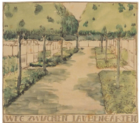
Kolorierte Ansichten für Laubengärten in Berlin-Schöneberg, Leberecht Migge 1918.

schen und zukunftsgerichteten Ansatz, der romantizierenden Gartengedanken wenig Raum lässt. Vom Nutzen bringenden Gartenbau versprach er sich zudem auch eine Steigerung der körperlichen und mentalen Gesundheit, die langfristig positive Auswirkungen auf die Volkswirtschaft haben werde.