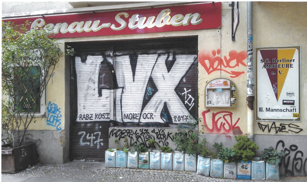
Urban Gardening in Berlin-Neukölln, 2017.

Der Begriff Urban Gardening steht für die gartenbauliche Nutzung städtischer Freiflächen. Dazu zählen auch aktivistische Initiativen, die sich städtischen Raum aus idealistischen Gründen individuell oder als Gruppe aneignen – mit illegalen, temporären, zuweilen aber auch längerfristig angelegten Gärten. Die Bewegung ist facettenreich und umfasst verschiedene Projekte wie Gemeinschaftsgärten, Guerilla Gardening, Dachfarmen, Kinderbauernhöfe, Kleingärten, «essbare Spielplätze», vertikale Landwirtschaft und mobile Gärten. Zwar unterscheiden sich die Ansätze und ihre praktische Ausführung, ihr Hintergrund ist jedoch fast immer partizipativ und gemeinschaftsorientiert.