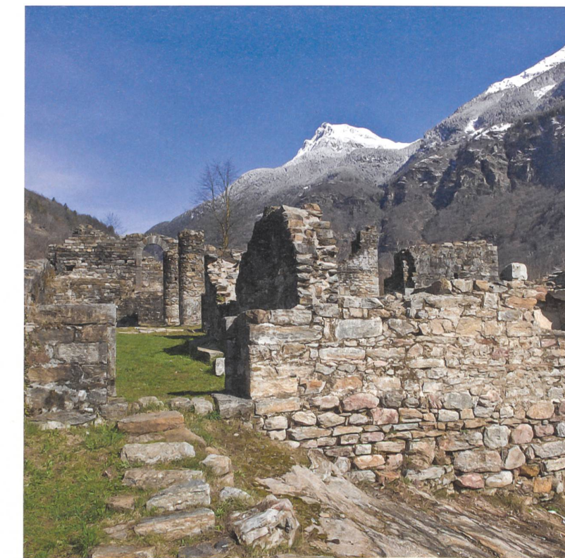
Burg Serravalle im Bleniotal.

sance, Barock und Klassizismus. Der Majorshof und das Von-Werra-Schloss gehören zu den schönsten Beispielen. An den Denkmaltagen führen die Eigentümer um und durch die Gebäude. Am Nachmittag wird den Besuchern zudem Zutritt in den Marmorsaal des Schlosses gewährt.