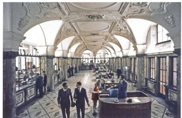
Bank Leuenhof in Zürich (Aufnahme von 1969).