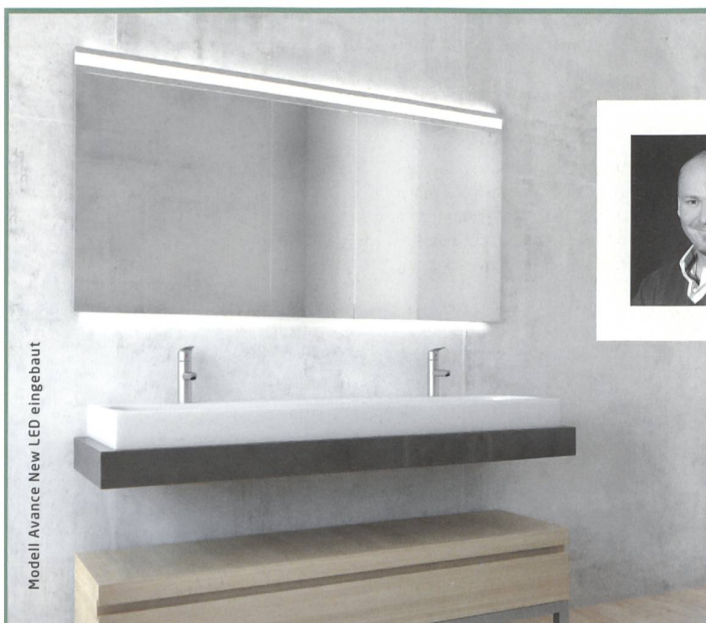
Modell Avance New LED eingebaut

Einen ausführlichen Bericht zu «Whatsalp» lesen Sie auf www.espazium.ch/whatsalp