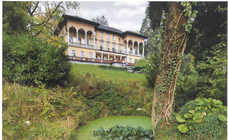
Villa Bellerive in Luzern.

In den Jahren 1887–1890 liess sich der Seidenfabrikant Martin Bodmer-von Muralt vom Architekten Arnold Bringolf an bester Aussichtslage in Luzern die Villa Bellerive erbauen. Der Bau mit seiner reichen Innenausstattung gehört zu den prachtvollsten Beispielen privater Villen seiner Zeit. Die Villa im italienischen Stil ist eingebettet in eine eigens geschaffene Parkanlage mit Höhlengrotte, Springbrunnen und Sitznischen. Die kantonale Denkmalpflege organisiert während der Europäischen Tage des Denkmals eine Führung durch die Räumlich-