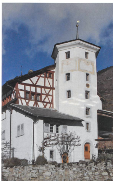
Majorshof in Leuk.