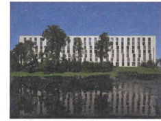
Sihlbogen, Zürich In Betrieb seit 2013/14; Baugenossenschaft Zurlinden