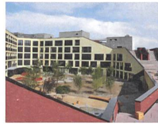
Kalkbreite, Zürich In Betrieb seit 2014; Genossenschaft Kalkbreite (TEC21 26–27/2014)