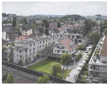
Burgunder Bern In Betrieb seit 2010; npg AG und wok Burgunder AG