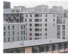
Hunziker-Areal, Zürich In Betrieb seit 2014/15; Genossenschaft Mehr als Wohnen (TEC21 13–14/2015)