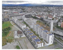
Erlenmatt West, Basel In Betrieb seit 2014/15; Verein «2000-Watt- Gesellschaft Erlenmatt West»