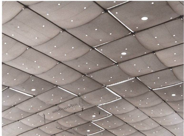
Das Dach des 2014 abgerissenen Metrodome in Minneapolis, einer Traglufthalle.