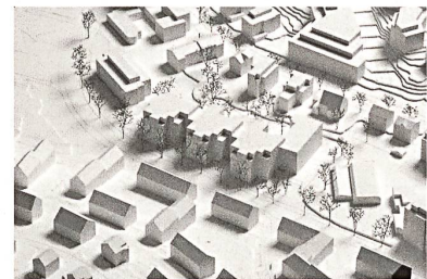
3. Rang: «Haus am Garten», von Adrian Streich Architekten mit Ganz Landschaftsarchitekten.