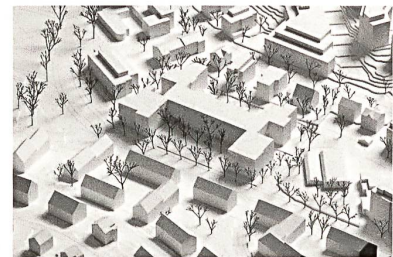
4. Rang: «Campari», von Enzmann Fischer Partner mit koepflipartner Landschaftsarchitekten.

Wirtschaftlich ist es aber noch nicht. Hoffen wir, dass der Spagat von Kostensenkung und Erhalt der Qualität mit der Überarbeitung gelingt. •