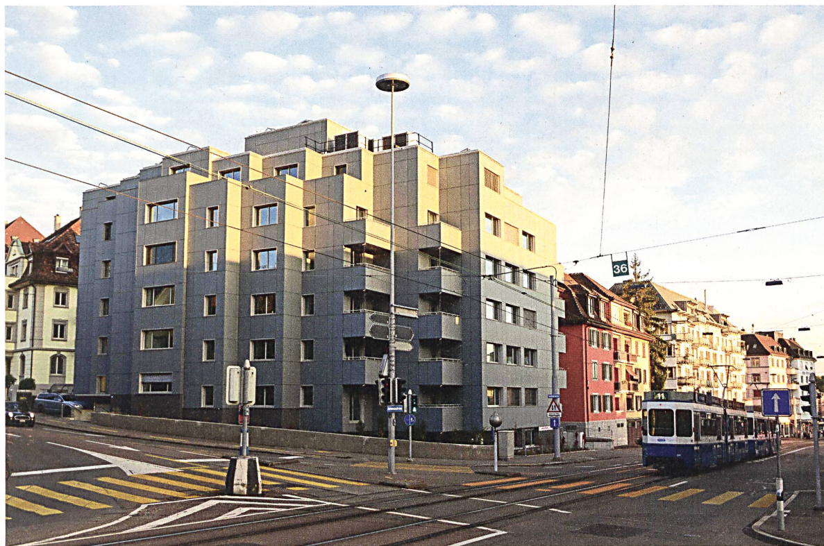
Das innerstädtische Mehrfamilienhaus mit aktiven Glasfassaden ist Plusenergiebau, Träger des Schweizer Solarpreises 2017 und ein öffentlich mitfinanzierter «Leuchtturm», der auch Forschungs- und Demonstrationszwecken dient (Architektur: Viridén + Partner).

in Sechserreihe und mit Neigungswinkel von 15^\circ nach Südwesten. Der Wirkungsgrad von monokristallinen Solarzellen erreicht fast 20%. Derselbe Modultyp wurde auch für die hinterlüfteten Aktivfassaden (und die Balkonbrüstungen) gewählt. Die matte Glasabdeckung reflektiert zwar mehr Sonnenlicht und reduziert die Leistung um rund einen Drittel. Hersteller sind aber daran, die Farbmodule laufend zu verbessern und die Einbussen unter 30% zu senken.